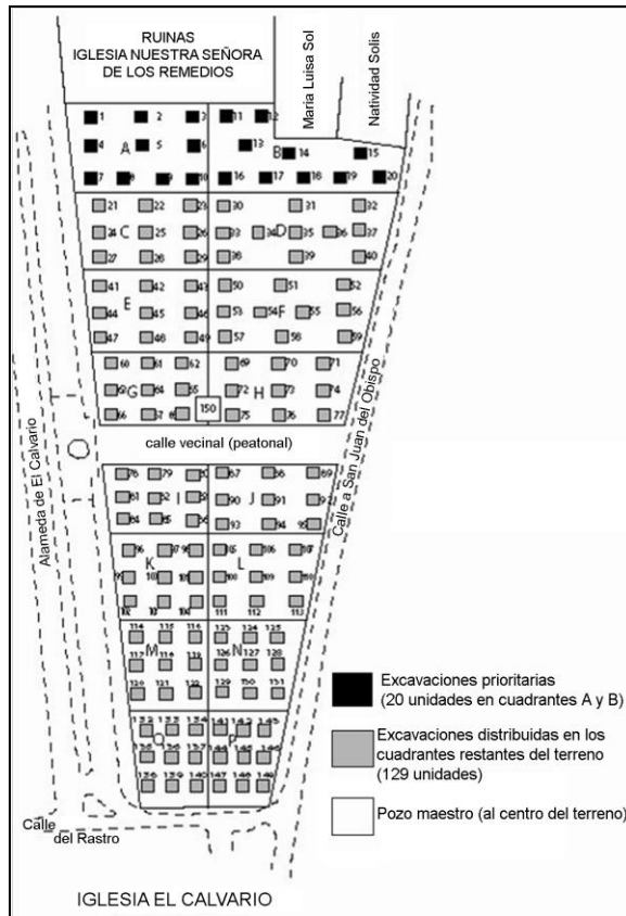
Figura 2 Plano del terreno con la ubicación de las unidades excavadas (los pozos están sin escala).