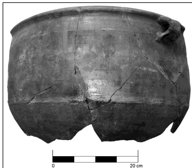
Figura 6 Vasija semicompleta de la Vajilla Villalpando encontrada en la Unidad D31.