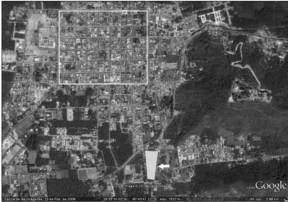
Figura 1 Ubicación del terreno investigado en La Antigua Guatemala. En recuadro la traza original del siglo XVI y la Plaza Real.