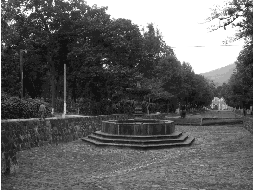
Figura 3 La Fuente del Campo y la Alameda de El Calvario. Nótese la diferencia de niveles entre la base de la fuente y el nivel actual de la Alameda.