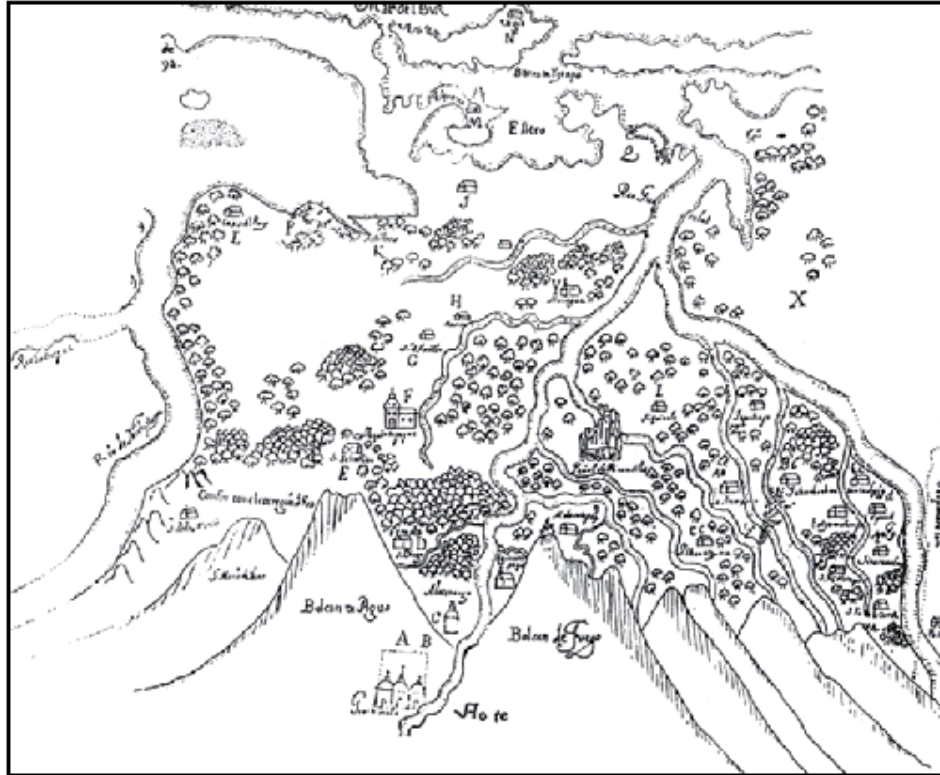
Figura 1. Fuentes y Guzmán: dibujo del valle de Santiago y sus pueblos periféricos (1993: TII, p. 75). En la parte superior el Mar del Sur (Océano Pacífico). Abajo Santiago, más arriba Alotenango y un poco más arriba (al costado izquierdo del Volcán de Fuego y San Pedro Aguacatepeque. Hacia el sur Escuintla hacia y hacia el poniente los pueblos que estaban en las faldas del volcán y después la región de Santa Lucía Cotzumalguapa.