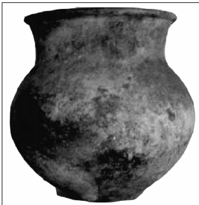
Figura 4 Olla de loza utilitaria, Instituto de Antropología e Historia