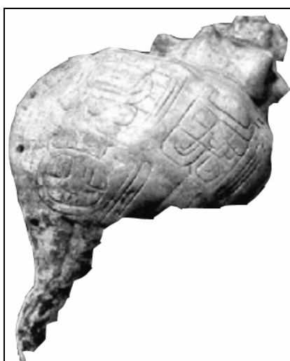
Figura 3 Caracol burilado, Instituto de Antropología e Historia