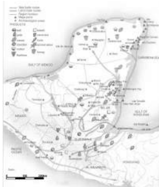
Fig.1: El sitio Vista Alegre dentro de las Tierras Bajas del norte de la península de Yucatán y su ubicación dentro de las rutas marítimas de comercio.

2014 Maya Coastal Production, Exchange, Life Style, and Population Mobility: A View from the Port of Xcambo, Yucatan, Mexico. Ancient Mesoamerica 25:221-238.