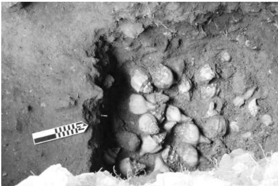
Fig.9: La Estructura 18 también mostró un gran número de modificaciones, las cuales corresponderán muy probablemente al uso intensivo de este edificio.