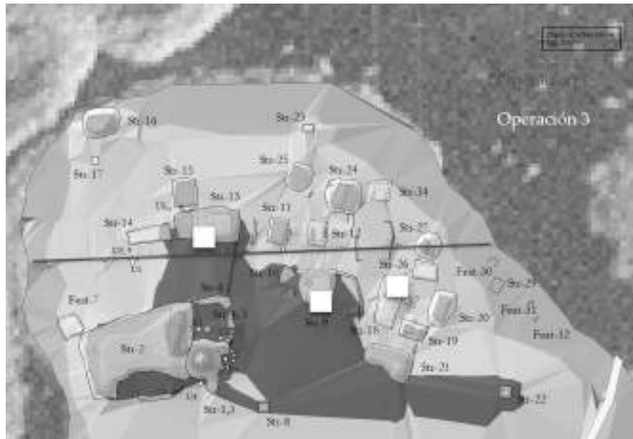
Fig.3: Las pequeñas dimensiones de la Isla y el alto número de estructuras hacen de Vista Alegre un sitio densamente ocupado.