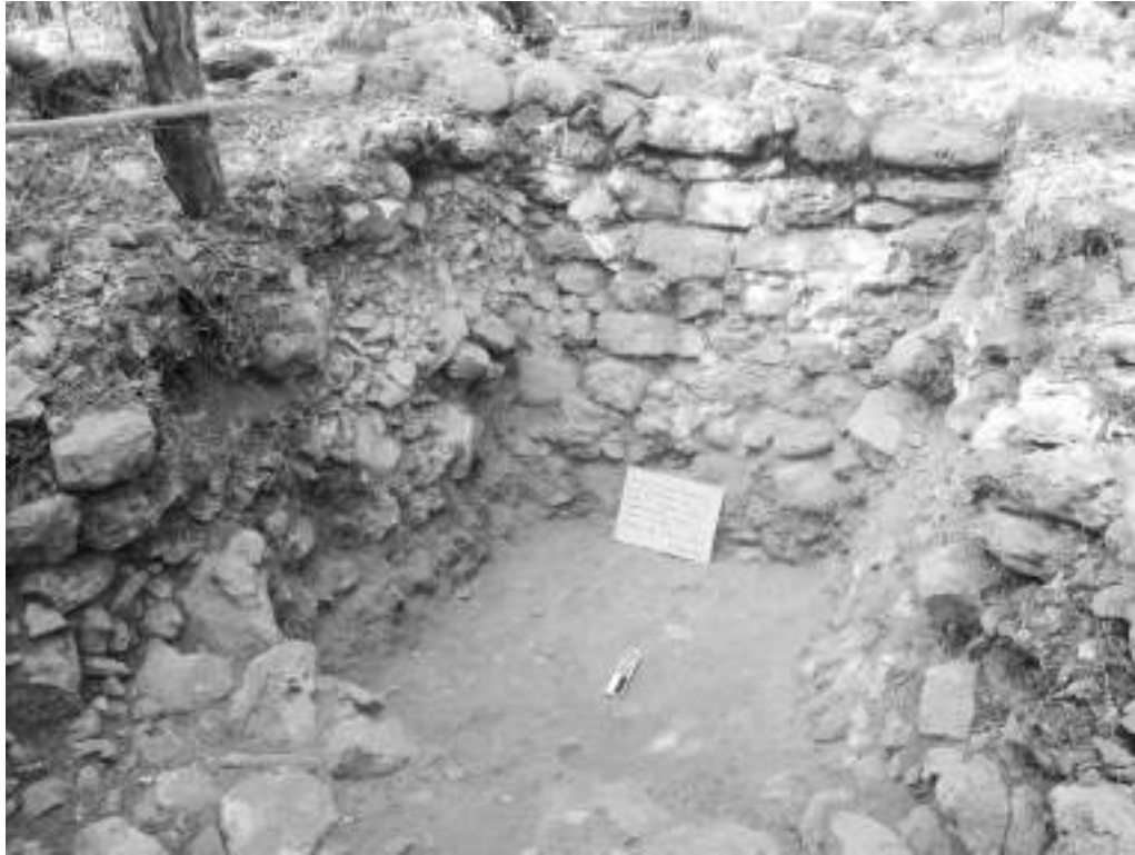
Fig.5: La Estructura 9 dejó ver que las construcciones han sido producto de distintos momentos de ocupación y modificaciones a través del tiempo.