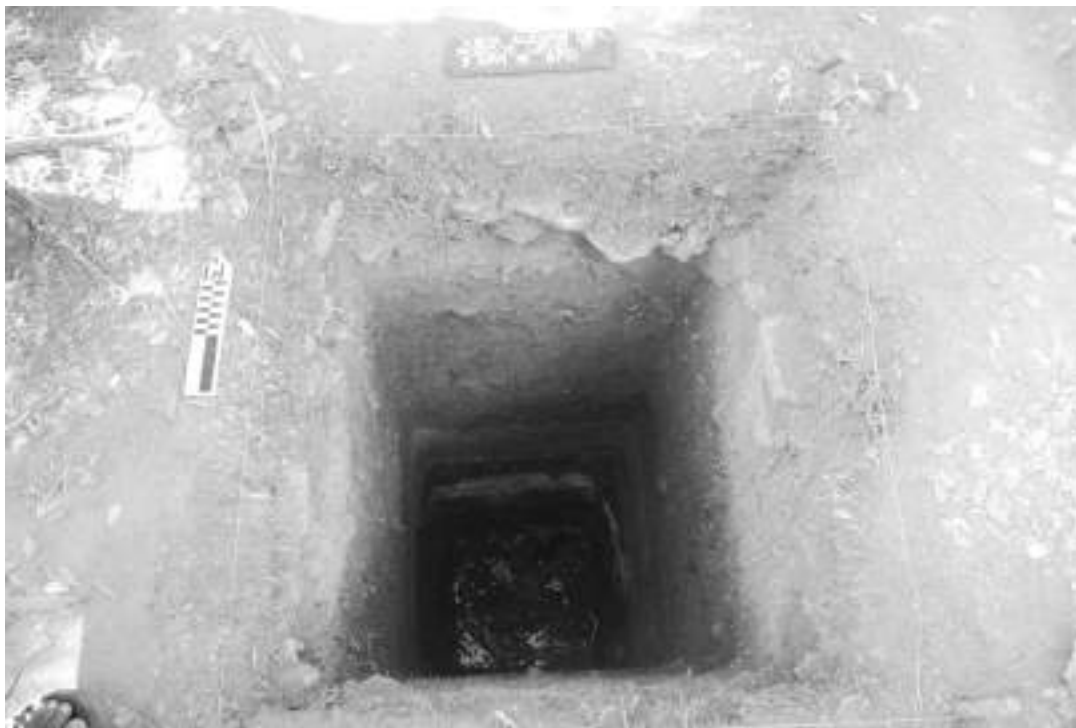
Fig.4: Los diferentes pozos de prueba arrojaron importantes datos sobre la ocupación en la Isla, tal fue el caso del Pozo 10.