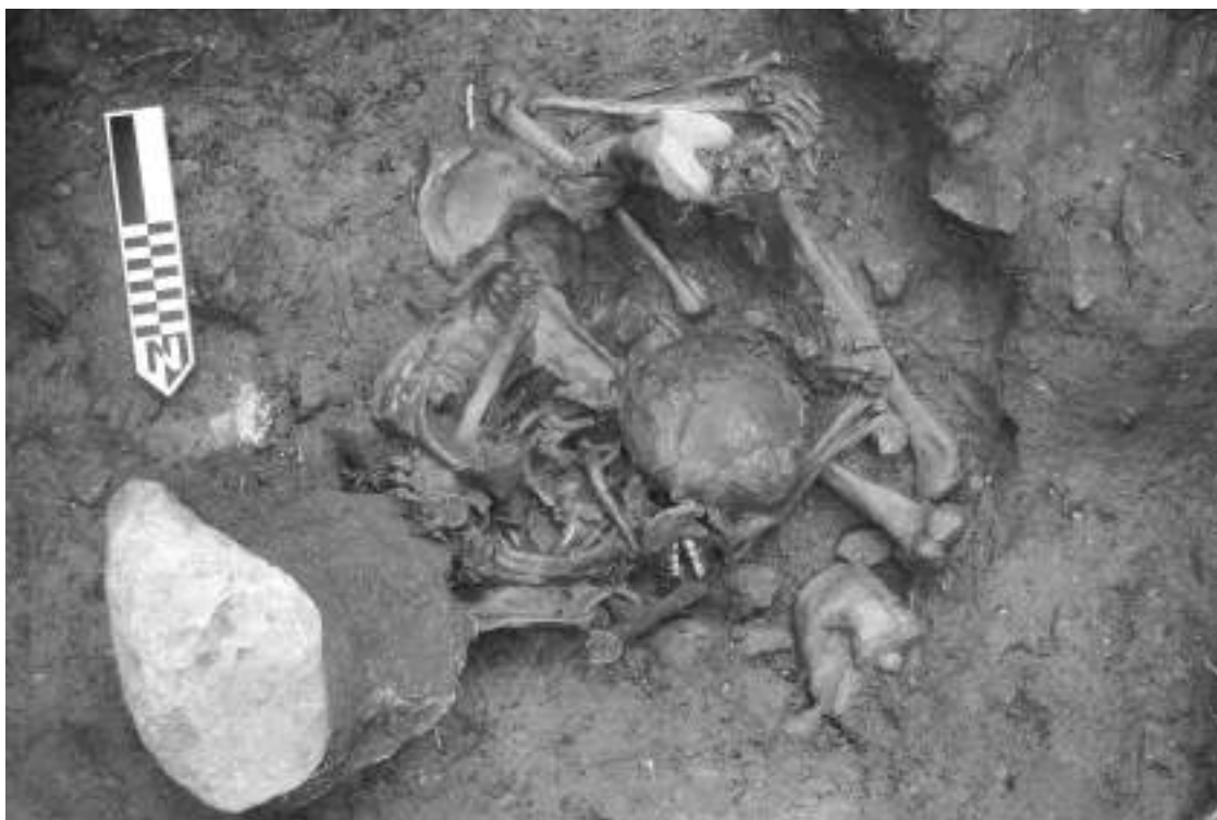
Fig.10: Al igual que en la Estructura 9, en la Estructura 18 vemos el uso del espacio exterior inmediato a la estructura para el enterramiento de parte de la población de Vista Alegre.