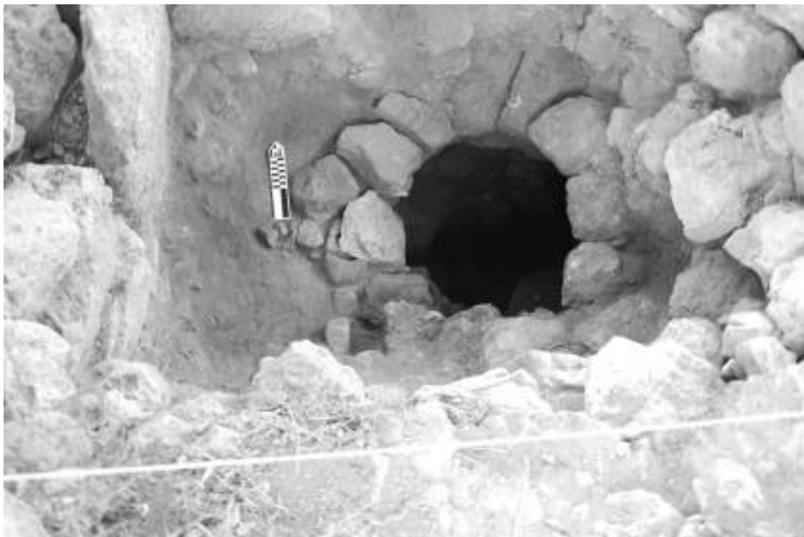
Fig.6: La presencia de materiales postclásicos en el relleno de la Estructura 9 ayudará a entender las distintas ocupaciones en el sitio.