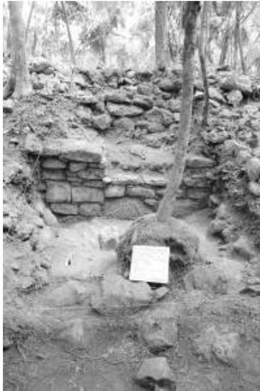
Fig.7: La Estructura 13 presenta uno de los mayores tamaños de la isla, lo cual pudiera estar relacionado con su función así como con su antigüedad.