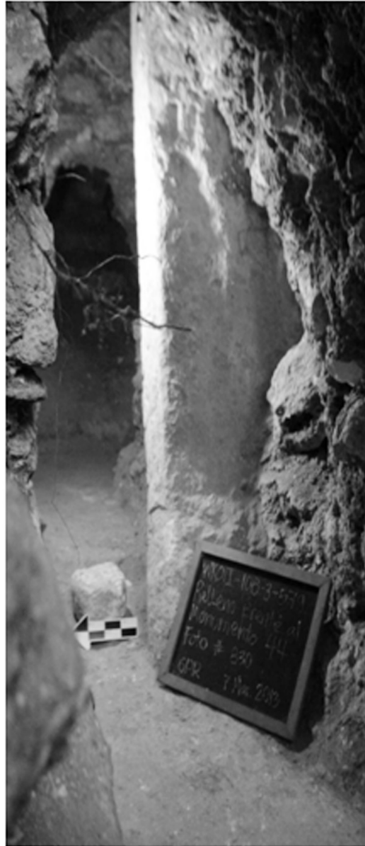
Fig.6: Ubicación de la Estela 44 en un corte del piso de plaza que después fue cubierto por nuevas construcciones (Fotografía: Griselda Pérez).