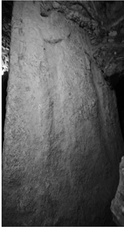
Fig.4: Sección frontal de Estela 44 donde se observa un rey viendo hacia adelante con los brazos sosteniendo una barra ceremonial.