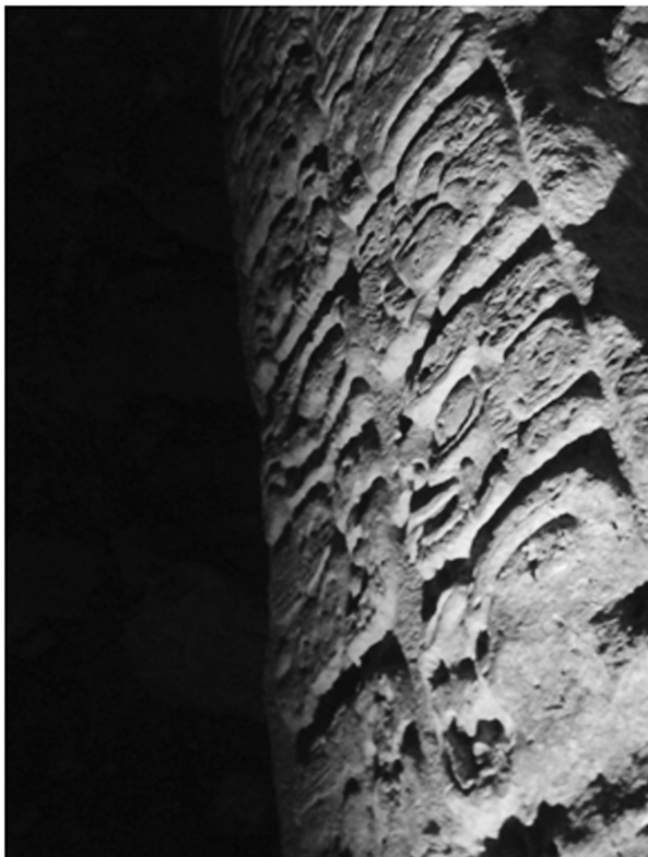
Fig.2: Estela 44.