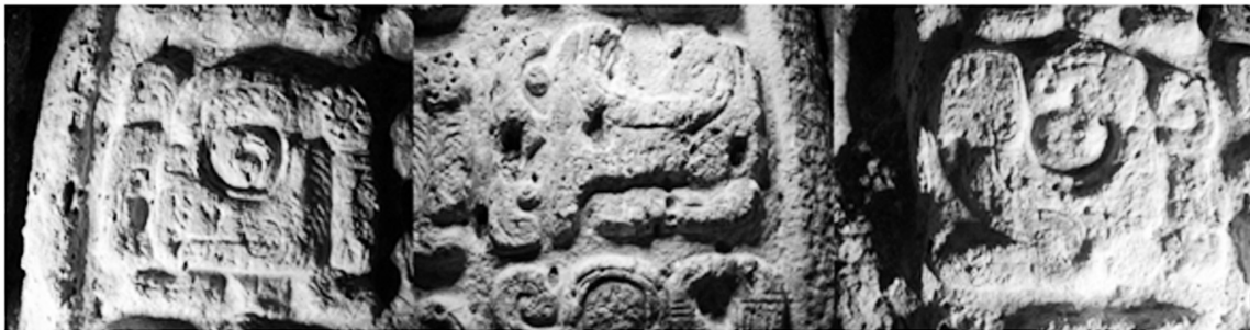
Fig.5: Texto refiere a una dedicación al rey Chak Tok Ich'aak y fue comisionada por su hijo Wa'oom Uch'ab Tz'ikin.