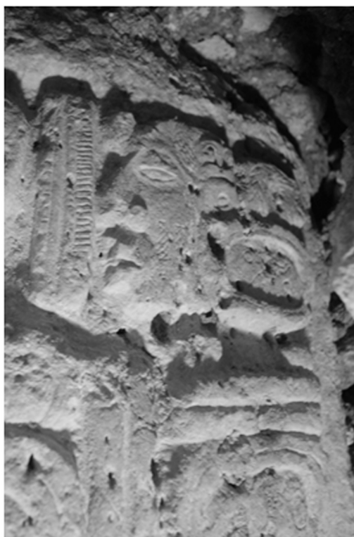
Fig.3: Identificación de nuevos personajes en la historia de Perú-Waka'.