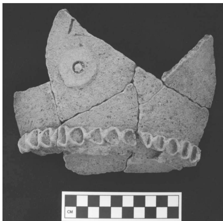
Figura 4 Mumúl Compuesto de Tayasal.