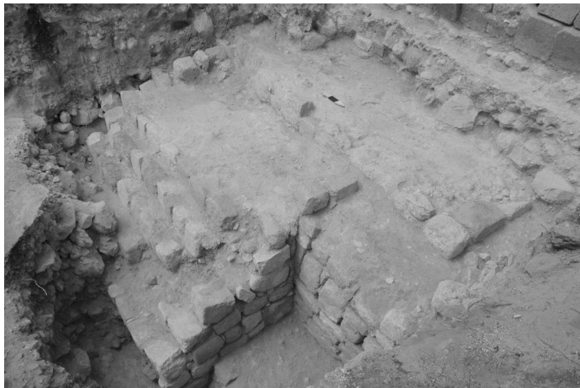
Figura 4 Estructura A-14 Sub 2.