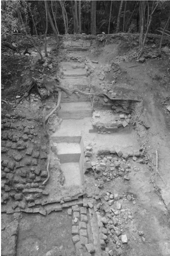
Figura 3 Estructura A-14 Sub 1.