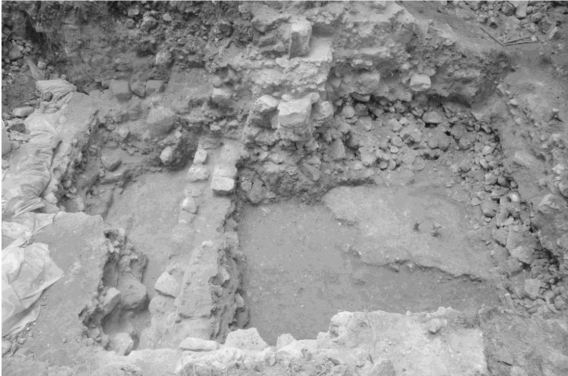
Figura 5 Estructura A-14 Sub 3.