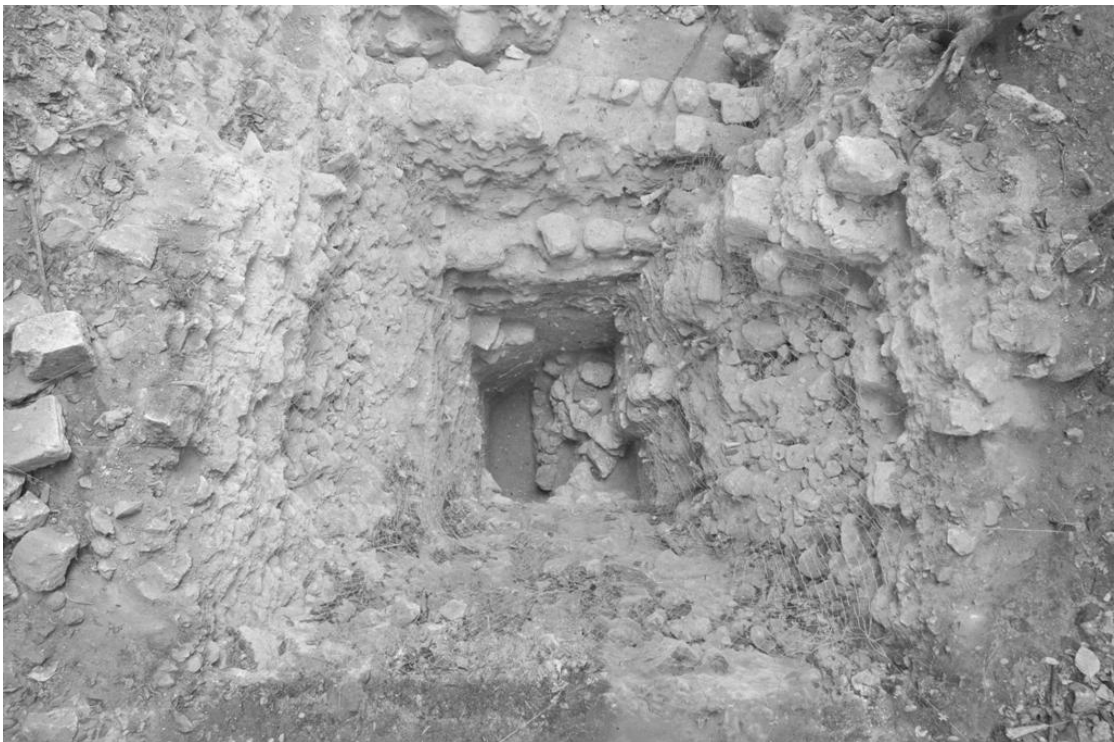
Figura 6 Estructura A-14 Sub 6.