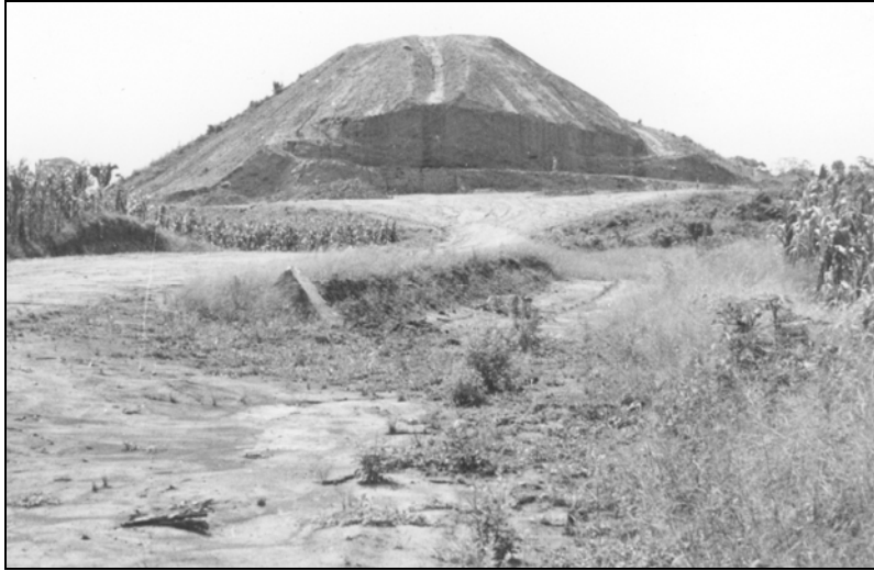
Figura 1 La Blanca Montículo 1 en 1972