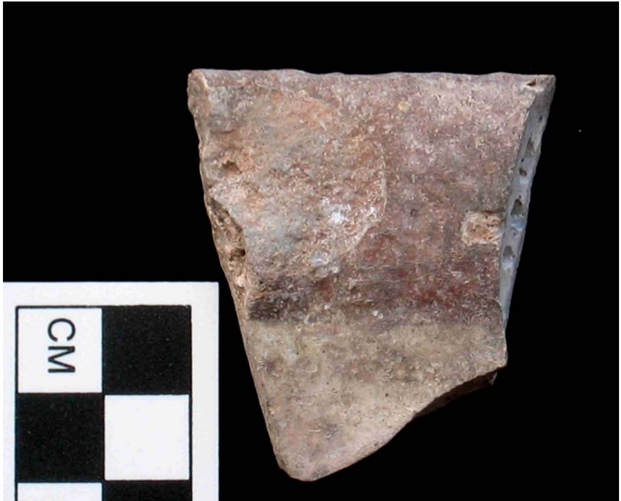
Figura 4 Foto de cerámica defectuosa (#50412).