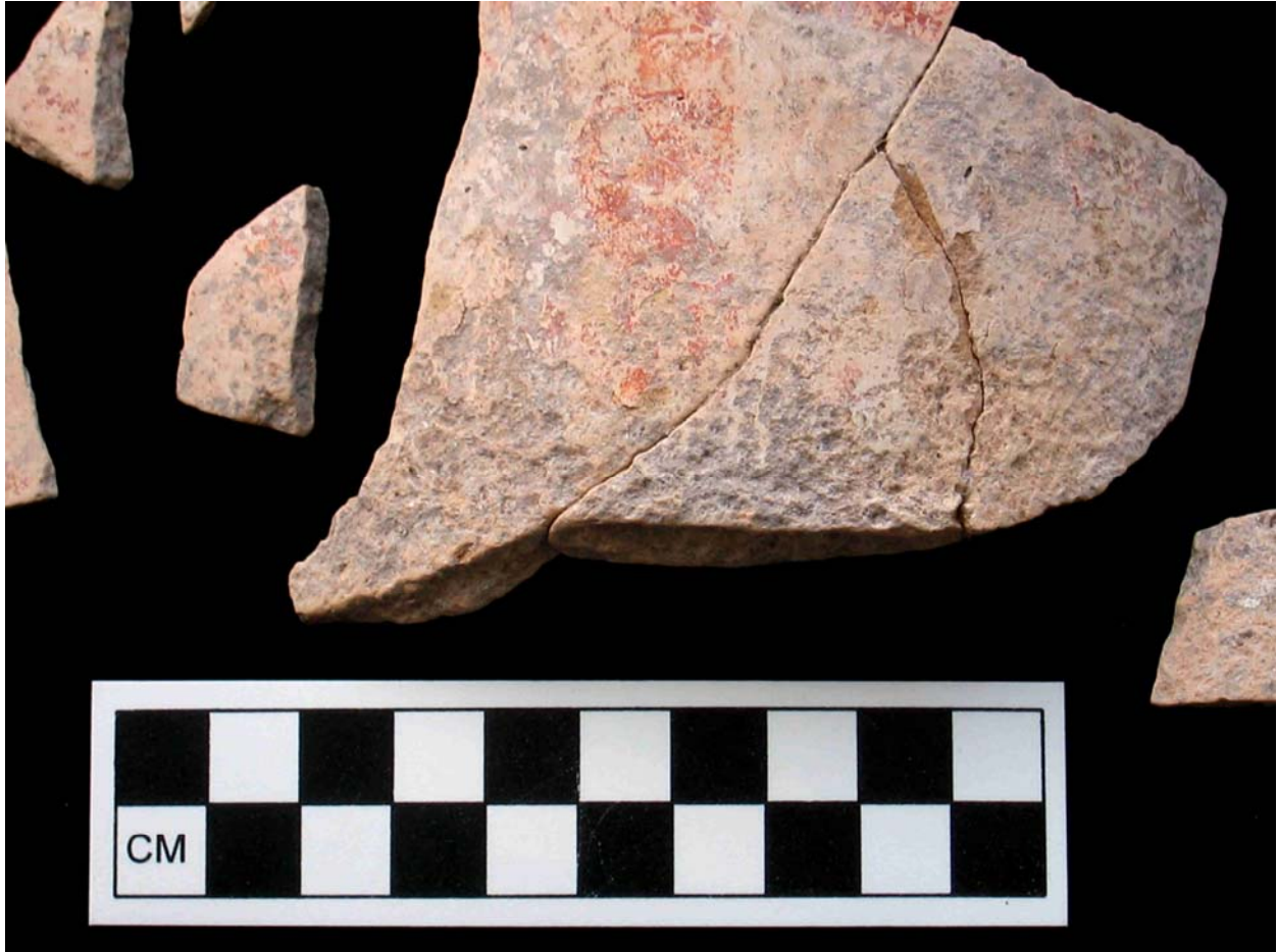
Figura 3 Foto de cerámica defectuosa (#50423).