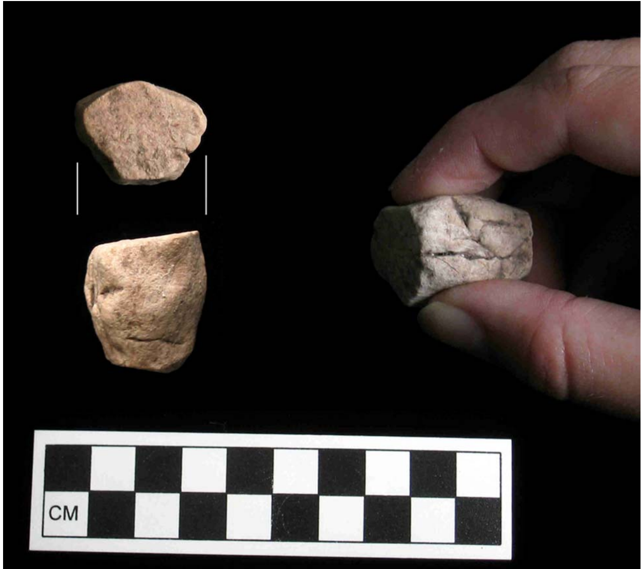
Figura 5 Foto de un pulidor calizo (GR-1)