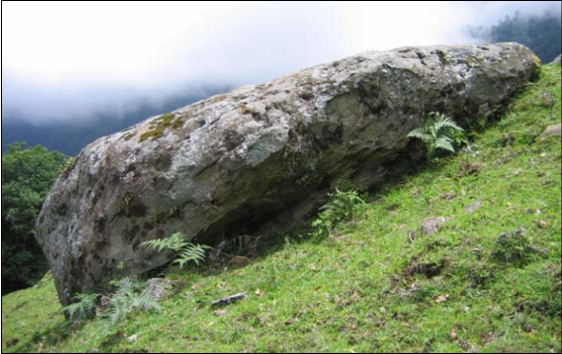
Figura 7 Piedra 1