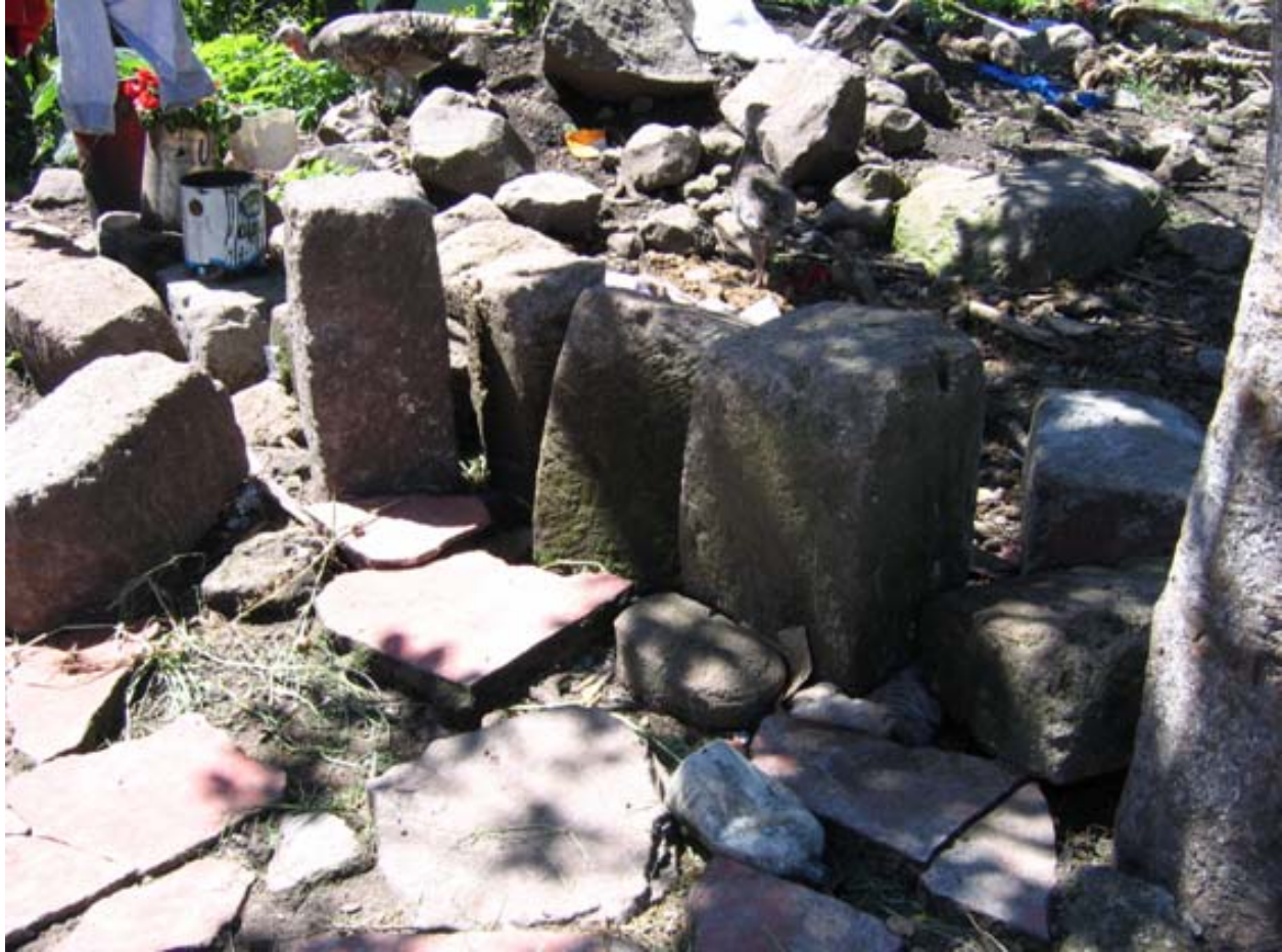
Figura 6 Vista de los sectores con mampostería en la estructura

En el sector sur de la estructura principal, aún sobre la plataforma original, a unos 17 m de distancia se sitúa un montículo pequeño que en la actualidad está sembrado, por lo que no se tuvo acceso al mismo.