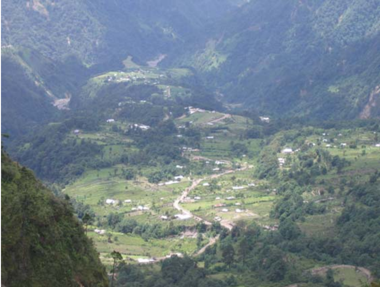
Figura 2 Vista del área

En los datos publicados, obtenidos del Censo General de Población de 1880, se lee: Las Barrancas, caserío del departamento de San Marcos, depende de la jurisdicción de la cabecera del mismo nombre. Los terrenos miden dos leguas cuadradas y sirven a la cría de ganado vacuno y caballar; 60 habitantes. En la Demarcación Política de la República de Guatemala (1892) y en el Boletín de Estadística (1913), figura como caserío Las Barrancas. La aldea cuenta con los caseríos El Aguacate, La Montaña y Las Ortigas.