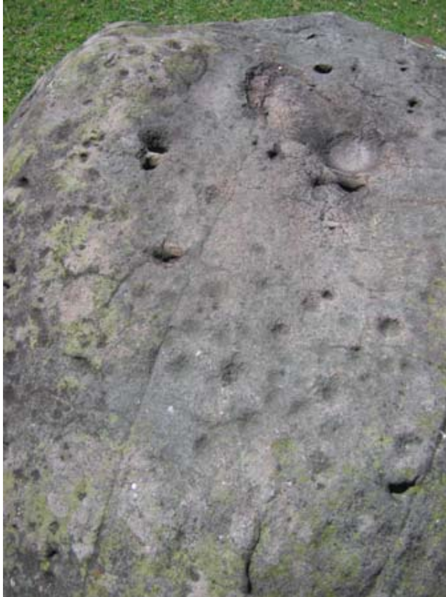
Figura 9 Piedra 2