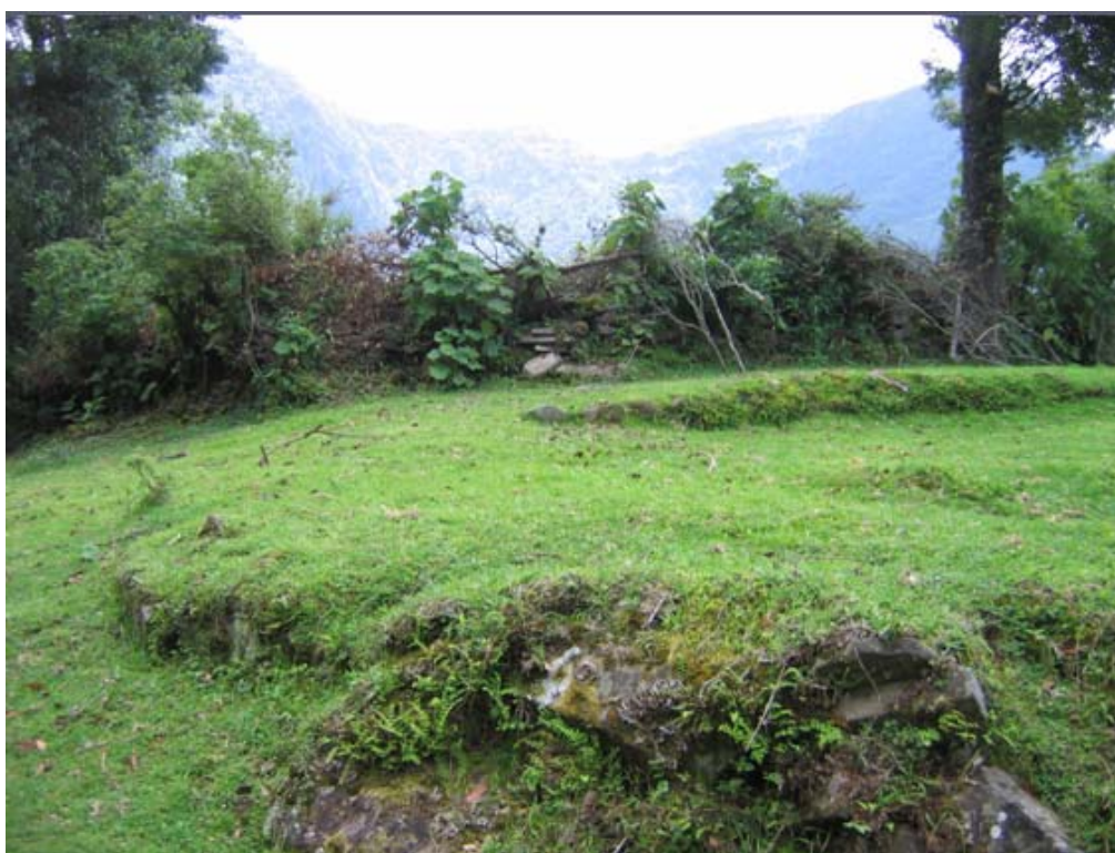
Figura 5 Vista de montículo