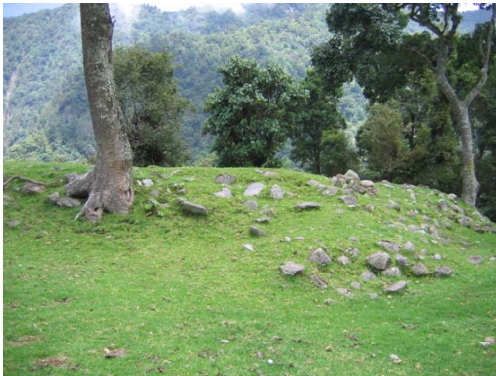
Figura 4 Vista de montículo