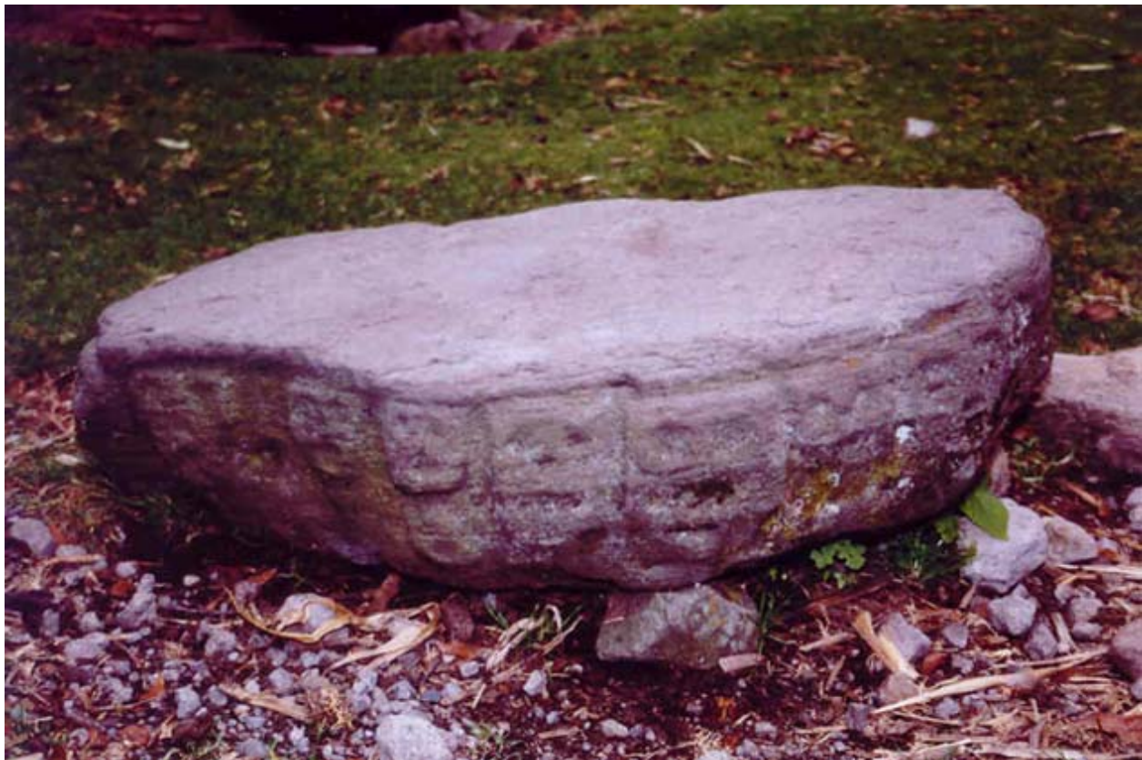
Figura 10 Monumento 2

El Monumento 3 difiere en ubicación a los anteriormente expuestos, pues se encuentra en la parte superior de la estructura principal, al centro de la misma, atrás del cuarto superior. Es una piedra de 0.82 m de largo por 0.70 m de ancho y 0.27 m de alto. Éste, al igual que el Monumento 2, no presenta en la superficie superior ningún tipo de trabajo; sin embargo, en sus costados existen tallas de carácter antropomorfo y zoomorfo (Figura 12), distribuidas por lo menos en tres de sus lados. Tiene en total nueve representaciones, tres por lado. Dichas representaciones cuentan con dimensiones variables. Las dos de las esquinas inferiores a la representación central, en los extremos, tienen dimensiones de 0.15 m x 0.15 m, mientras que las de las posiciones centrales, son de 0.20 m de ancho x 0.17 m de alto.