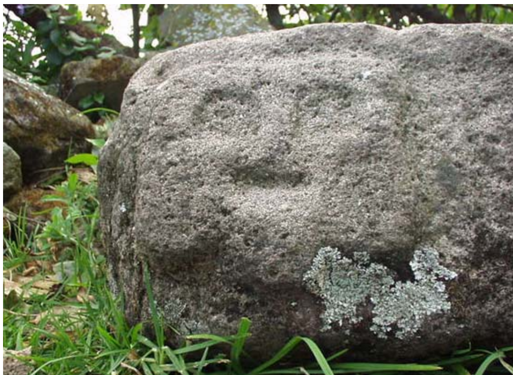
Figura 11 Detalle de rostro