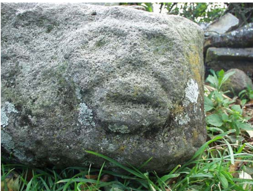
Figura 12 Detalle de rostro