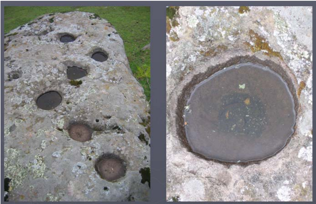
Figura 8 Piedra 1