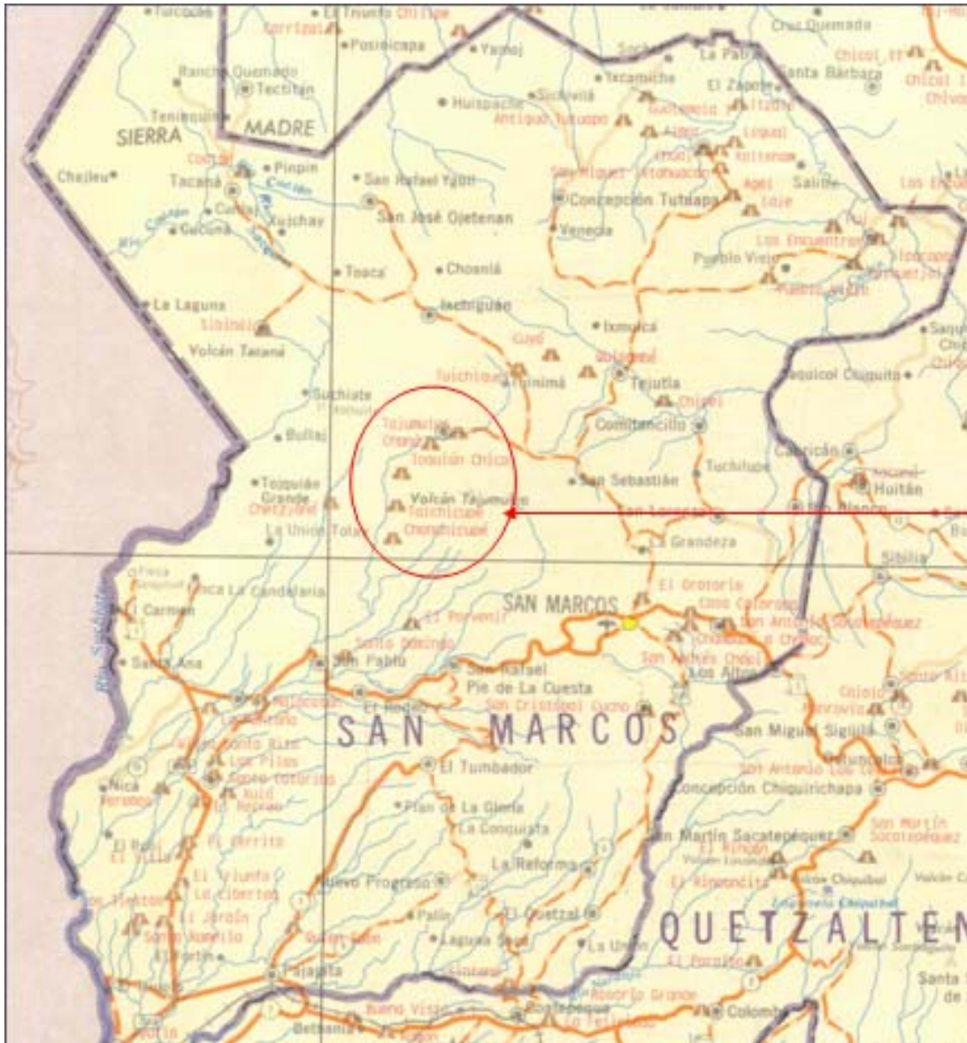
Figura 1 Ubicación del área en el municipio de San Marcos

La aldea Barranca de Gálvez, se ubica en el municipio de San Marcos. Al este del río Cabuz, a 7.5 km por vereda, al este-noreste de la cabecera, en la falda sur del volcán Tajumulco. A 2040 m sobre el nivel del mar, latitud 14°59'00", longitud 91°51'00".