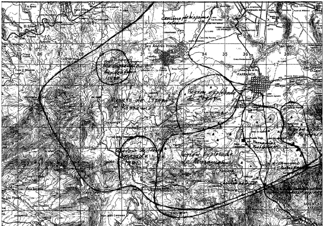
Figura 1 Ubicación de Los Santos Inocentes de Parramos (escala 1:50,000)

El primer camino explorado parte del paraje de Panaj, donde se encuentra actualmente la población de Parramos y se dirige hacia el sur pasando por el sitio ceremonial de Xejuyu (coordenadas 365141), que fue reportado por Edwin Shook (1952:35-39). Cerca de este sitio existen dos puntos de habitación: uno al noroeste (coordenadas 363143); y otro en una colina al este (coordenadas 3721440). El camino desciende por las joyas de Xejuyu, donde existen evidencias de un sitio habitacional (coordenadas 371137), y la de El Aguacate, rumbo al paraje de Patzite, donde se encuentran evidencias de habitación (coordenadas 368121). Llegando al paraje de Parijuyu, lugar que estuvo poblado (coordenadas 371112) y que estuvo situado próximo al camino, siendo, según las evidencias encontradas en el Archivo General de Centroamérica, un campamento español probablemente elaborado entre los meses de febrero a noviembre de 1526, poco antes de la fundación de la ciudad de Santiago en el valle de Almolonga. Este campamento se pudo haber localizado cerca del sitio ceremonial Pompeya, junto a San Miguel Escobar.