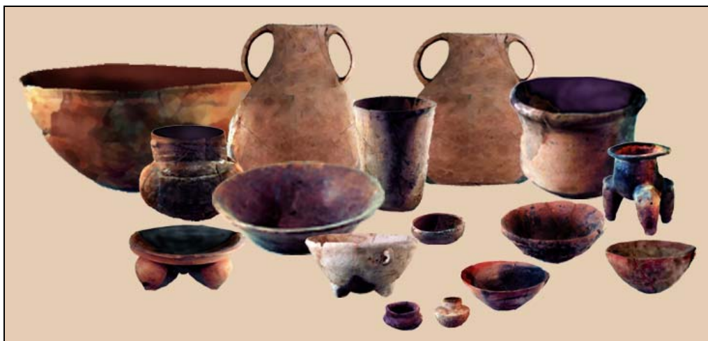
Figura 3 Ejemplares del Complejo Aurora

Durante la fase Aurora (200-350 DC), en la parte inicial del Clásico Temprano, o del Preclásico Terminal (como se ha considerado en la presente investigación), en el lugar continuó la colocación de ofrendas; los siete hallazgos Arenal y los siete Aurora así lo ejemplifican. Los hallazgos asignados a Aurora representan el 17.94% del total de hallazgos de La Trinidad-Kaminaljuyu; los rasgos de actividad doméstica decrecen de 23.07% en tiempos Arenal a 7.69% en Aurora, y sus componentes representan solamente el 14.28% de la fase, en contraste con la presencia de ofrendas propias de actividades rituales, la cual es del 24% de la muestra total de La Trinidad-Kaminaljuyu, y es sorprendentemente el 85.71% de la fase; lo que evidencia el aspecto ritual que ha alcanzado el lugar, antes de tiempos de la fase Esperanza.