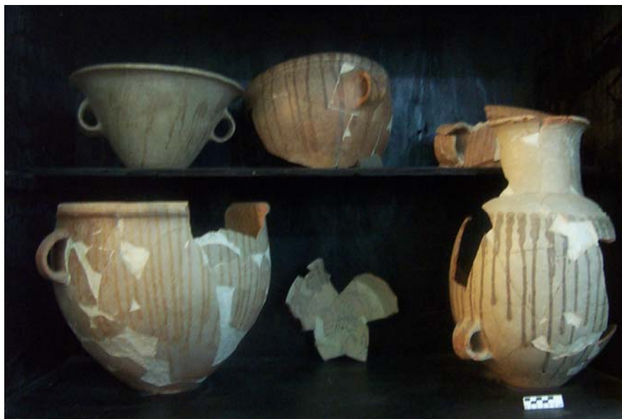
Figura 3 Formas cerámicas del complejo Yabnal/Motul

El Complejo Yabnal/Motul del Clásico Tardío (600-800/830 DC), no había sido reconocido en Chichen Itza por investigaciones anteriores, hasta el análisis de la cerámica procedente de las exploraciones del Cenote Sagrado en los años sesenta realizado en 1998 (Pérez de Heredia 1999). Consecuentemente, el conocimiento de este complejo cerámico ha aumentado considerablemente gracias a la excavación completa de la Estructura 5C4-I, en el Templo de la Serie Inicial, logrando con ello la separación del complejo Yabnal/Motul n dos subfases: la fase Media y la Tardía-Terminal (Figura 3).