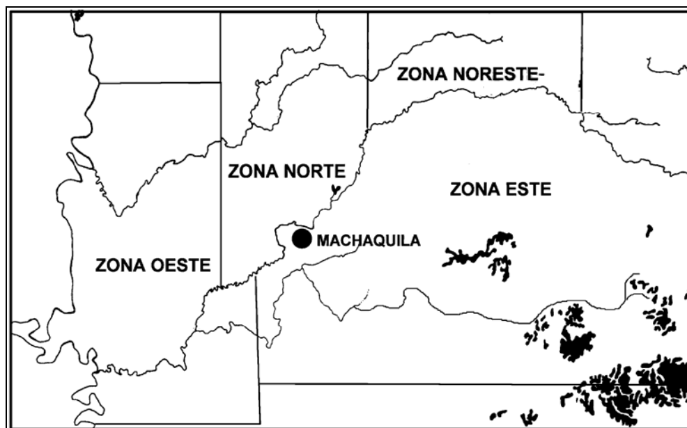
Figura 2 Sectores geográficos en la región de Machaquila