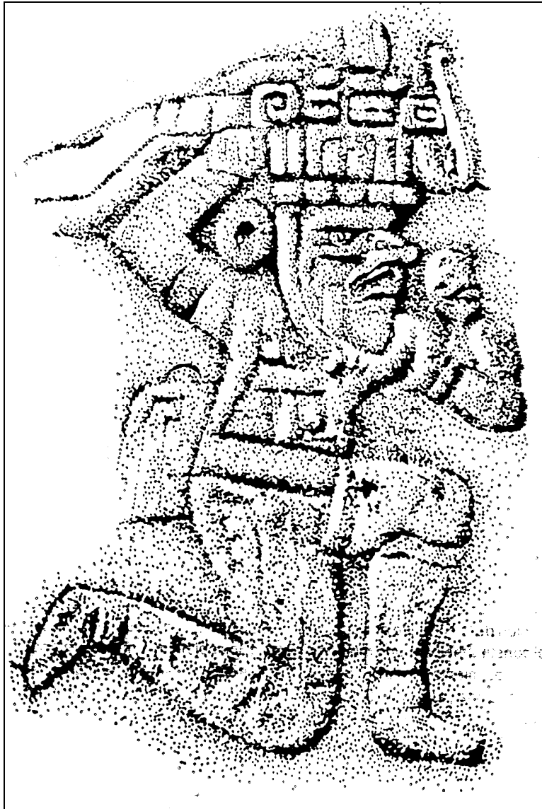
Figura 2 Monumento 1 de Tak'alik Ab'aj

Sur y difunde muy poco hacia otros complejos, en donde se le puede identificar como intrusa en el inventario local.