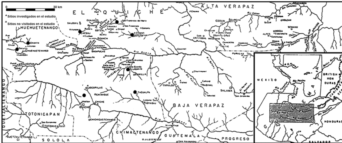
Mapa 1 Distribución de sitios arqueológicos con cerámica de la Tradición Solano en el Altiplano Noroccidental de Guatemala (Adaptado de Smith 1955:fig.42)

El complejo cerámico de estos sitios es muy similar al que ingresó a Kaminaljuyu a principios del Clásico Temprano, e incluye lo siguiente: