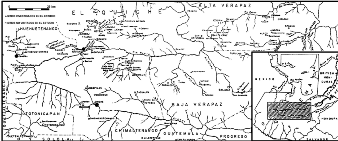
Mapa 2 Sitios arqueológicos en el Altiplano Noroccidental de Guatemala que corresponden al Preclásico Medio (Adaptado de Smith 1955:fig.42)

A diferencia del Altiplano Noroccidental, en el Altiplano Central (departamentos de Chimaltenango, Sololá, Sacatepéquez y Guatemala), la ocupación era bastante densa durante el Preclásico. No obstante, la mayoría de estos, excepto en el departamento de Guatemala, fueron abandonados en el Preclásico Tardío, incluyendo al sitio Chiché. La escasez de centros mayores al noroccidente del valle de Guatemala parece indicar conflicto y el desarrollo de una zona de amortiguamiento entre la región noroccidental y Kaminaljuyu. Este último centro alcanzó su máximo poderío en el Preclásico Tardío, en parte tal vez porque atrajo a la población procedente de otras áreas conflictivas del Altiplano Central. De cualquier manera, de este momento en adelante Kaminaljuyu estuvo involucrado activamente en lo que se conoce como la Esfera Miraflores, una red comercial que ligaba al valle de Guatemala con la Costa Sur, el occidente de El Salvador y el valle inferior del Motagua (Demarest y Sharer 1986:194-223).