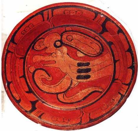
Cui tipo Cui Naranja Policromo