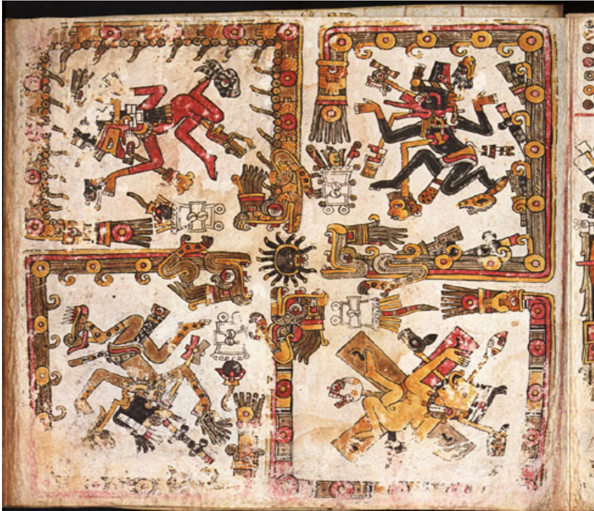
Figura 6 Códice Borgia, lámina 72: Cuatro direcciones del universo