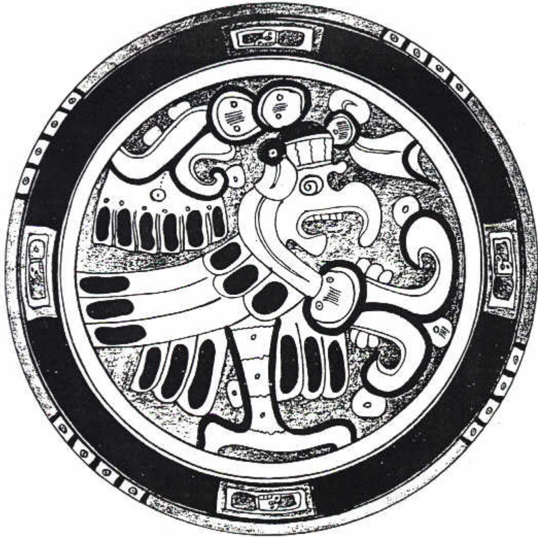
Figura 8 Ave Moan representada en la cerámica policroma del grupo Cui