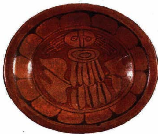
Cui tipo Cocay Naranja Policromo