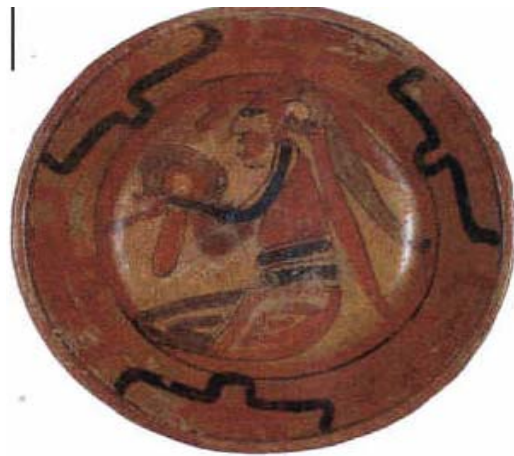
Chukul tipo Chukul Naranja Policromo