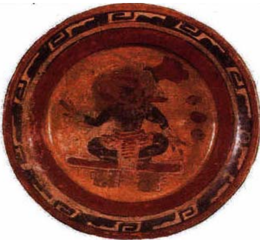
Saxche tipo La Jola Naranja Policromo