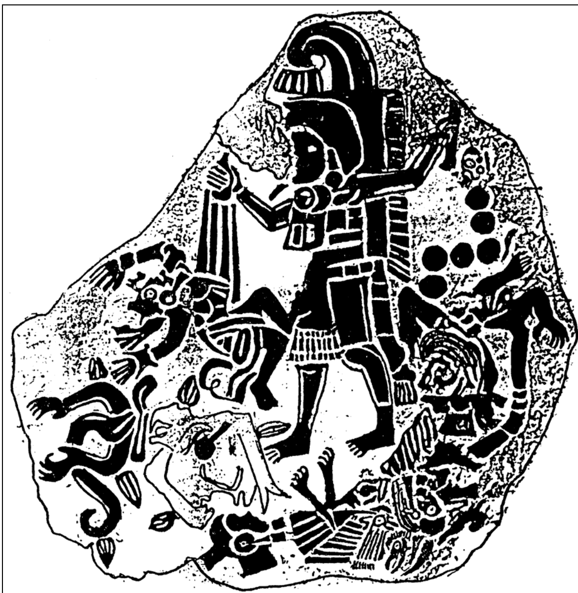
Figura 7 Monumento 4, El Baúl

"No está claro, si el Gobernante 2 fue responsable de la violencia o si la figura que representa la muerte es el grupo local en general, actuando bajo la dirección del Gobernante 1".