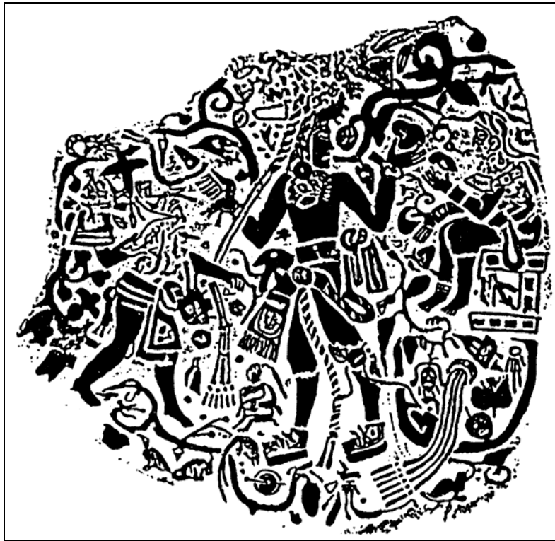
Figura 3 Monumento 21, Bilbao