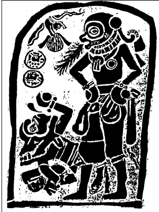
Figura 9 Monumento 27, El Baúl

Por lo tanto, tomando en cuenta que pueden existir indicios de un movimiento revitalizador en Cotzumalguapa, por la evidencia que puede interpretarse hasta el momento gracias al análisis escultórico, apoyado por la evidencia cerámica, se analizará desde un punto de vista muy general algunas de las condiciones específicas que determinan un movimiento revitalizador: