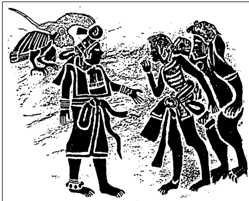
Figura 4 Monumento 19, Bilbao