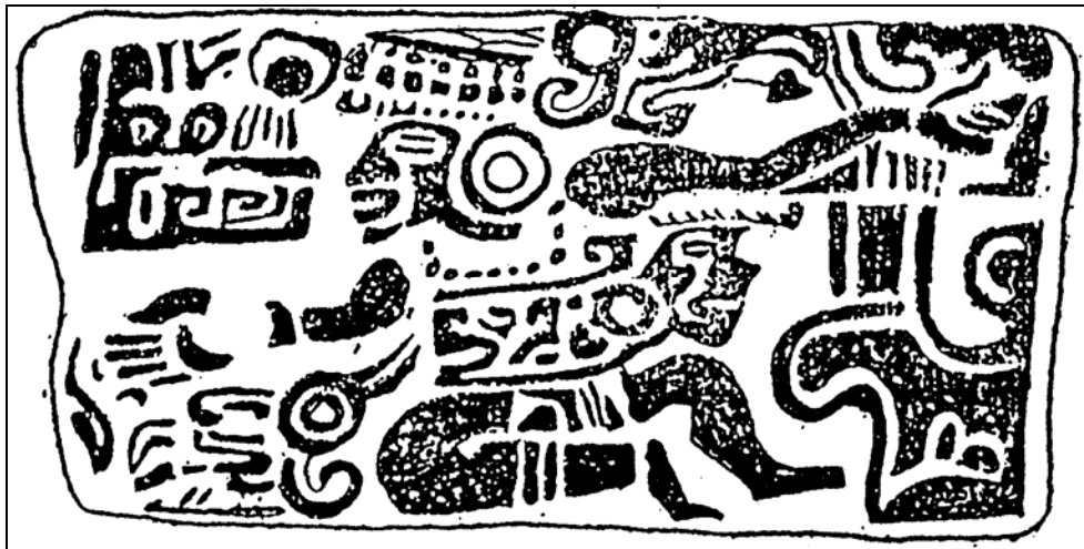
Figura 5 Cuenco de vajilla Tiquisate, Museo Popol Vuh (No.0223)

En la decoración grabada del cuenco Ni 0225 está la representación de dos personajes que están relacionados con el juego de pelota, ya que ambos llevan yugo a la cintura. La escena es un tanto sanguinaria, ya que representa una decapitación. El personaje de la izquierda sostiene un cuchillo con la mano derecha y la cabeza de decapitado con la mano izquierda. Es interesante notar que de la boca del personaje sale una espiral o vírgula que parece indicar que está hablando. El personaje de la derecha, que ha sido la víctima, está hincado, lleva un yugo con forma de serpiente en la cintura y del cuello salen las figuras de seis serpientes (Figura 6).