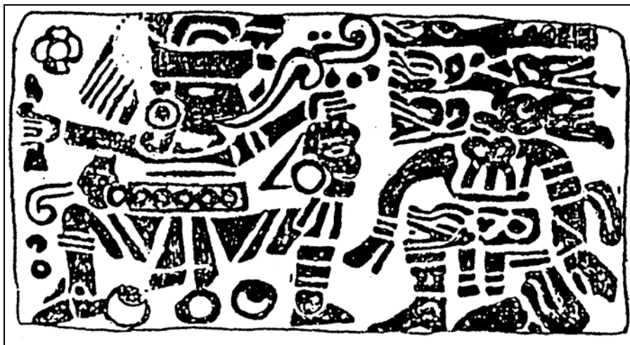
Figura 6 Cuenco de vajilla Café-Negro Pulido, Museo Popol Vuh (No.0225)

En la decoración grabada del cuenco Ni 0225 está la representación de dos personajes que están relacionados con el juego de pelota, ya que ambos llevan yugo a la cintura. La escena es un tanto sanguinaria, ya que representa una decapitación. El personaje de la izquierda sostiene un cuchillo con la mano derecha y la cabeza de decapitado con la mano izquierda. Es interesante notar que de la boca del personaje sale una espiral o vírgula que parece indicar que está hablando. El personaje de la derecha, que ha sido la víctima, está hincado, lleva un yugo con forma de serpiente en la cintura y del cuello salen las figuras de seis serpientes (Figura 6).